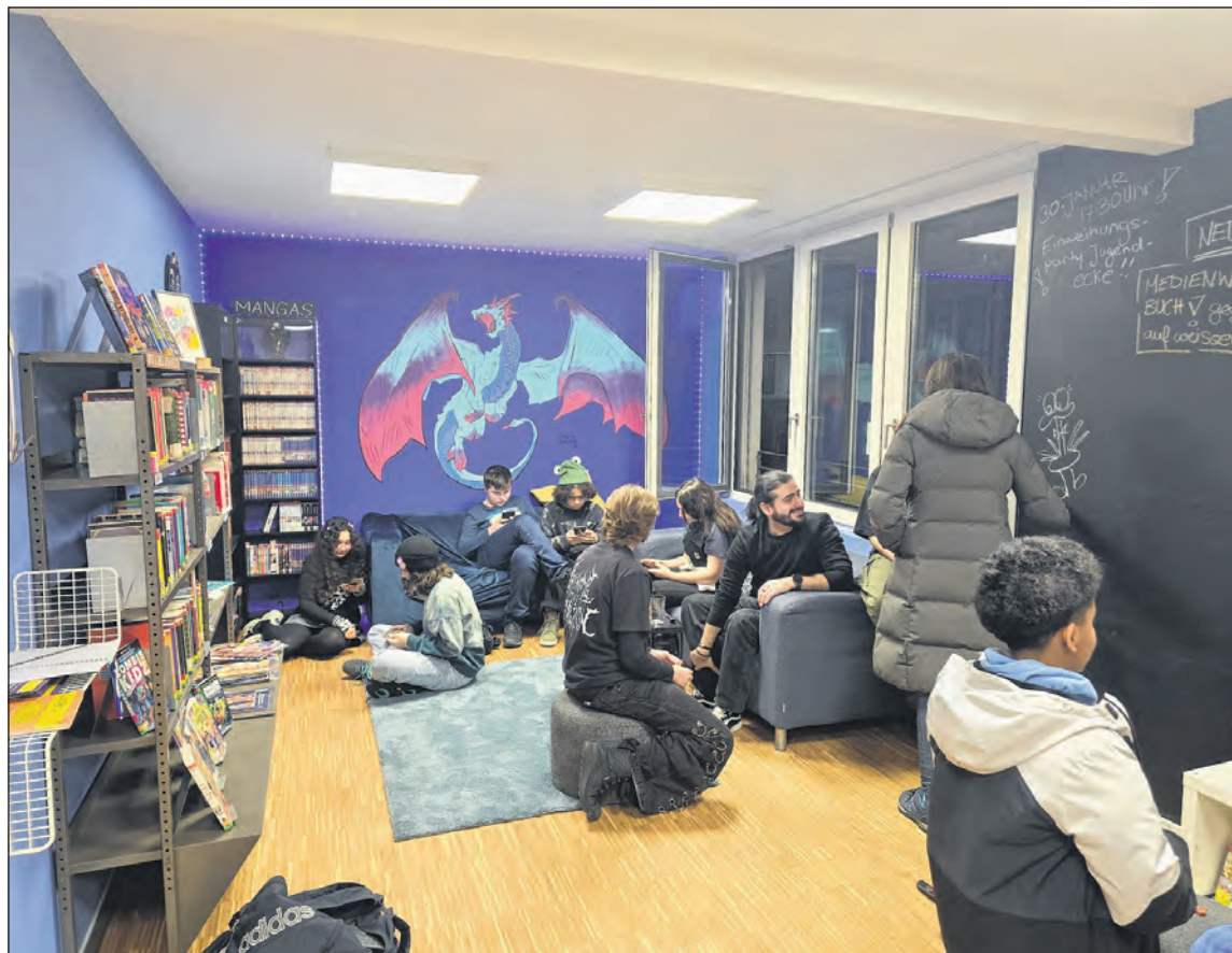
Der neu gestaltete Jugendcorner wurde im Januar mit einer Eröffnungsparty eingeweiht.