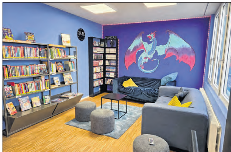
Die Innenansicht vorher (links) und nachher zeigt das eindruckliche Resultat des kreativen Projekts.